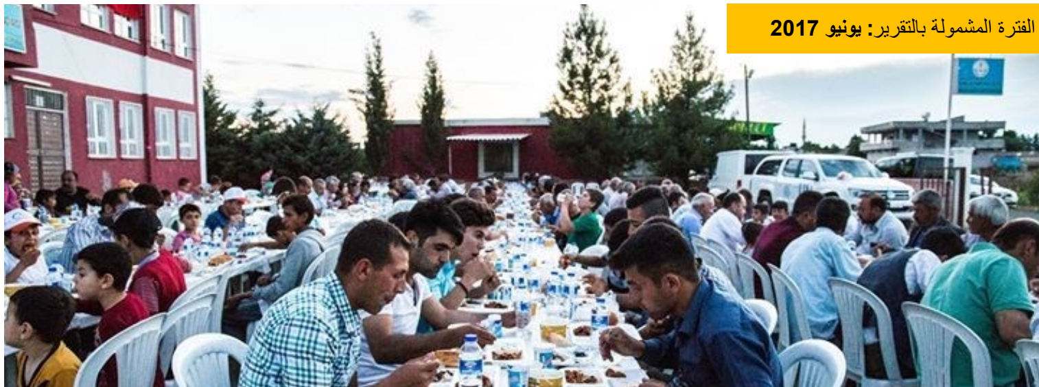
مشاركة اللاجئين السوريين وأفراد المجتمع المضيف في الإفطار الذي نظّمته المنظمة الدولية للهجرة، بوزوفا.