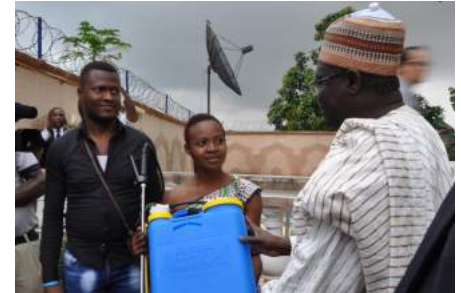
Le Ministre pour la jeunesse et l'éducation civique Mounouna Foutsou remet à deux bénéficiaires le matériel pour commencer une activité dans l'élevage de poulets, Yaoundé, 8 juin 2018.

de revenu. « Ce que nous faisons aujourd'hui c'est un exemple de bonne collaboration entre le gouvernement et une organisation internationale » a déclaré le Ministre Foutsou.