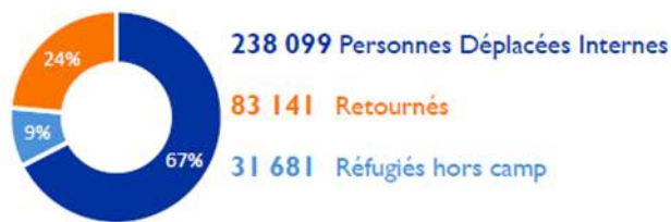
Résumé de l'estimation des populations déplacées au moment du round 13 de la DTM à l'Extrême-Nord, 12 au 24 avril 2018.

L'OIM ne prétend pas donner une information parfaite ni complète pour