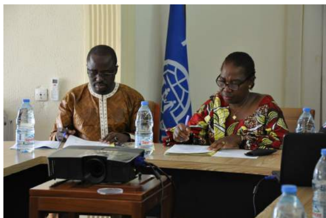
Cérémonie d'ouverture de la formation pour les enquêteurs. Était aussi présente Mme Naomie Begala Mikel, Ministre Plénipotentiaire de la Direction des Camerounais à l'Etranger, des Etrangers au Cameroun, des Réfugiés et des Questions Migratoires, Yaoundé, 26 juin 2018

La formation a été conduite par le Bureau Central de Recensement et d'Etude de la population au Cameroun (BUCREP) aussi à travers l'utilisation de smartphones et d'une application pour portable pour faciliter la récolte des données.