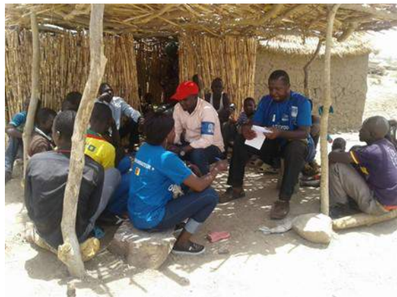
Le travail des énumérateurs sur le terrain est d'aller au plus près des populations déplacées pour s'enquérir de leur situation, leur localisation ainsi que de leurs intentions de retour.

Cette année, l'OIM au Cameroun continue ses activités dans la région de l'Extrême-Nord afin d'apporter son soutien aux populations affectées par le conflit lié à Boko Haram. Elle le fait au travers de son principal projet dans cette Région du Cameroun : la DTM ou Displacement Tracking Matrix (matrice de suivi des déplacements, en français). Ce projet permet d'informer toutes les parties prenantes (communauté humanitaire, gouvernement, etc.) sur la situation des populations affectées afin que les interventions humanitaires soient mieux ciblées et plus efficaces. En avril, plus précisément du 12 au 24, la première collecte de données de l'année (la 13 ème au total) sur les mouvements et conditions de vie des populations déplacées a eu lieu. Elle a permis d'estimer à plus de 352 000, le nombre de déplacés dans la Région.