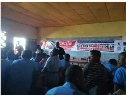
Etudiants de l'école de Bafoussam, 20 avril 2018

Qu'est-ce que c'est la migration irrégulière? Quelles en sont les conséquences? Quels sont les risques de se retrouver vulnérables et sans papiers dans un pays autre? Et quelles sont les procédures pour migrer de façon régulière sans mettre sa vie à risque?