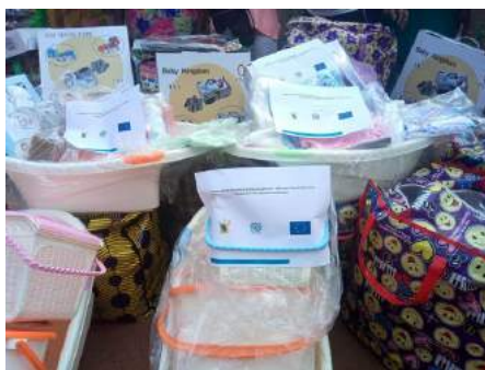
Kits bébé distribués par l'OIM, Yaoundé, 19 mai 2018

Dans le cadre de ce projet, l'OIM assiste les camerounais en détresse désireux de rentrer au pays. A leur arrivée à l'aéroport, les migrants sont enregistrés et reçoivent une assistance immédiate comprenant une prise en charge psychologique et sanitaire. Les femmes enceintes et celles avec des petits bébés reçoivent aussi des kits pour leurs bébés. Cette assistance à l'arrivée est coordonnée avec les Ministères des Relations extérieures, de la Jeunesse et de l'Education Civique, de la Santé Publique, des Affaires Sociales, de l'Administration Territoriale, et la Délégation Générale à la Sureté Nationale.