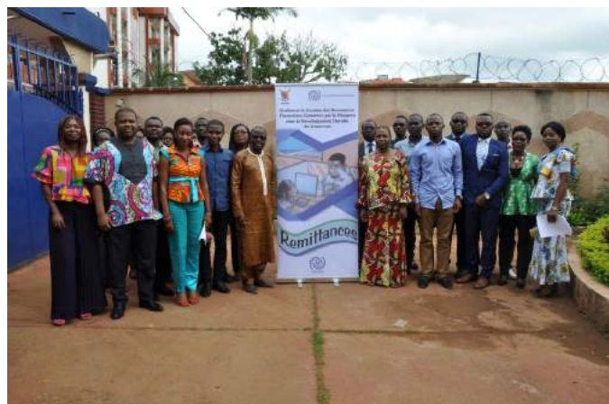
Photo de groupe des enquêteurs, Yaoundé, 26 juin 2018