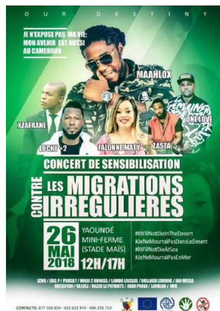
The billboard of our first concert, Melen, 26 May 2018

On May 26, the first concert of our awareness-raising campaign on the risks of irregular migration took place.