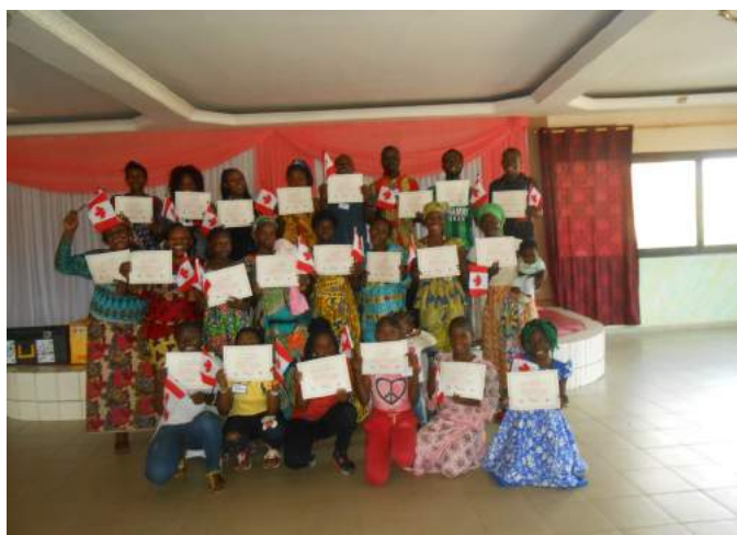
Central-African-Republic refugee children receive certificate of cultural orientation classes, June 2018

In April 2018, 226 refugees from Central African Republic (CAR) living in Cameroon have been supported by IOM to start their new life in Canada and the US. Out of the 226 refugees, 145 were selected for resettlement to Canada and 81 to the US.