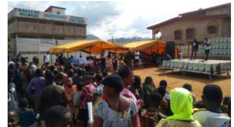
Public in Melen, 26 May 2018

The concert was organized by our implementing partner "Our Destiny" and involved the participation of more than 10 Cameroonian artists.