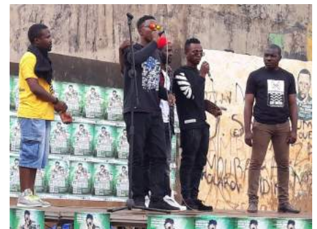
The artists on stage, Melen, 26 May 2018

The activity started in the early afternoon, when more than 500 young Cameroonians participated in the educational quiz on irregular migration, and had the chance to listen to testimonies from two Cameroonian migrants who presented real life experiences about irregular migration and the dangers one could suffer on the way and at destination, when travelling without documents.