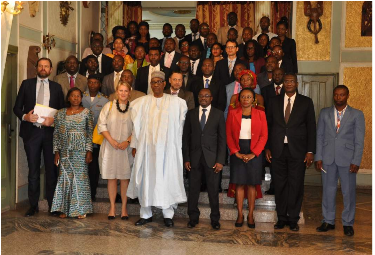
Photo de groupe à l'issue de la deuxième réunion du comité de pilotage, Yaoundé, le 18 septembre 2018.