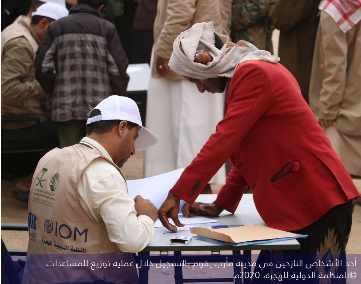
أحد الأشخاص النازحين في مدينة مأرب يقوم بالتسجيل خلال عملية توزيع للمساعدات

الوحدة التنفيذية، بالتنسيق مع المنظمة الدولية للهجرة، بمشاركة مستند تعقب الاستجابة بشكل يومي مع الشركاء العاملين في المجال الإنساني، حيث يبين تفاصيل أنشطة الاستجابة التي ينفذها الشركاء. وتتولى المنظمة الدولية للهجرة قيادة عملية تحديد مواقع النزوح الجديدة، وتقوم بمشاركة المستجدين اليومية مع الشركاء المحليين والشركاء العاملين في المجال الإنساني.