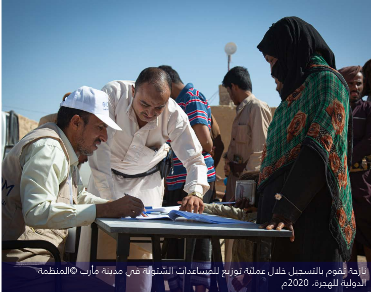
نازحة تقوم بالتسجيل خلال عملية توزيع المساعدات الشهرية في مدينة مأرب

ولرصد تحركات النزوح ومعرفة الاحتياجات وتنسيق عملية تقديم الخدمات في مأرب، فإن المنظمة الدولية للهجرة والوحدة التنفيذية لإدارة مخيمات النازحين داخلياً تتشاركان ترأس منتدى التنسيق الطارئ والذي ينعقد بشكل منتظم وتشارك فيه المنظمات غير الحكومية، حيث يهدف هذا المنتدى إلى التعرف على الاحتياجات في القطاعات ذات الأولوية – المتمثلة في إدارة المخيمات وتنسيق أنشطتها، والمأوى والمواد غير الغذائية، والمياه والصرف الصحي والنظافة، والغذاء وسبل كسب العيش، والصحة – والاستجابة لهذه الاحتياجات. وتواصل المنظمة الدولية للهجرة بتبادل المعلومات حول مواقع واحتياجات النزوح الجديدة مع الشركاء المحليين والإنسانيين، وتقوم الوحدة التنفيذية، بالتنسيق مع المنظمة الدولية للهجرة بمشاركة متتبع الاستجابة الإنسانية بانتظام مع الشركاء.