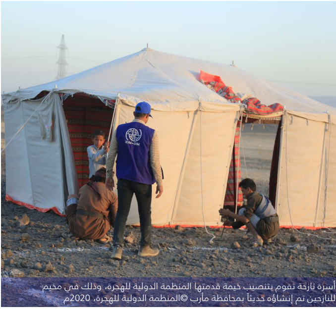
أسرة نازحة تقوم بتنصيب خيمة قدمتها المنظمة الدولية للهجرة، وذلك في مخيم للنازحين تم إنشاؤه حديثاً بمحافظة مأرب

• تقوم الكتلة الوطنية الفرعية لإدارة المخيمات وتنسيق أنشطتها والكتلة الوطنية الفرعية للمأوى والمواد غير الغذائية في مأرب (المنظمة الدولية للهجرة) بتنسيق الاستجابة لحالات الطوارئ على أرض الواقع في شراكة وثيقة مع الوحدة التنفيذية.