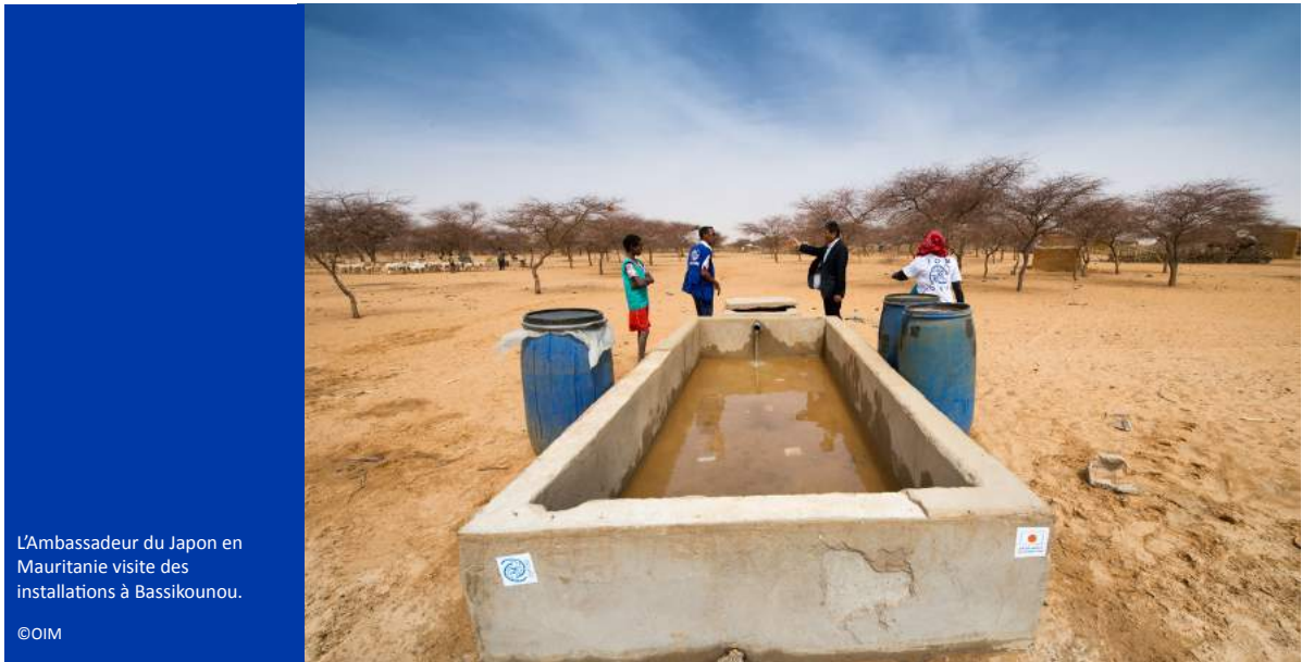
L'Ambassadeur du Japon en Mauritanie visite des installations à Bassikounou.