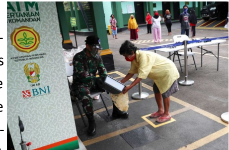
Les « distributeurs de riz » en Indonésie fournissent du riz aux résidents éligibles

D'autres pays , tels que l'Italie, la Nouvelle-Zélande, l'Australie , le Myanmar et l'Ouzbékistan, ont adopté de nouveaux programmes pour faire face à la pandémie, qui couvrent également les migrants, en particulier ceux qui ont un permis de séjour ou un visa de travail temporaire. Des mesures spécifiques destinées aux migrants ont également été adoptées dans certains pays, comme au Panama pour quelque 2 500 migrants en détresse, fournissant à ces derniers de la nourriture et un logement.