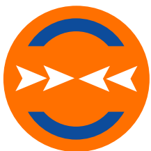
Protection des personnes en situation de déplacement