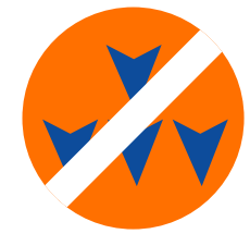
Lutte contre le trafic illicite des migrants

Chaque programme national est conçu en fonction de son contexte local et met en œuvre des activités adaptées aux besoins.