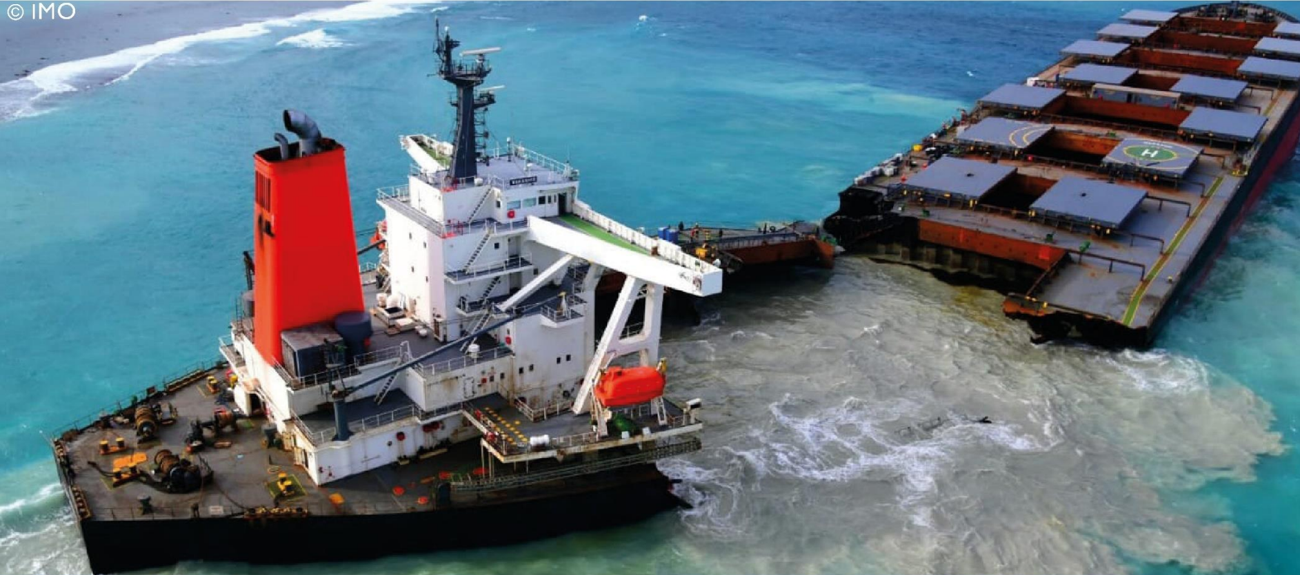
L'OIM FOURNIT EXPERTISE TECHNIQUE ET SOUTIEN OPÉRATIONNEL AU GOUVERNEMENT DE MAURICE POUR CONTENIR LA MARÉE NOIRE