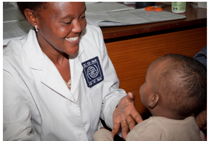
Una enfermera de la OIM en Nairobi vacuna a un niño contra el sarampión.

La información anonimizada puede analizarse para apoyar el establecimiento de políticas y prácticas de base empírica, crear conciencia sobre las prioridades de salud de los migrantes y contribuir a la base factual sobre la salud de los refugiados y los migrantes.