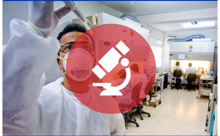
La OIM cuenta con más de 25 laboratorios propios y colabora con laboratorios externos.