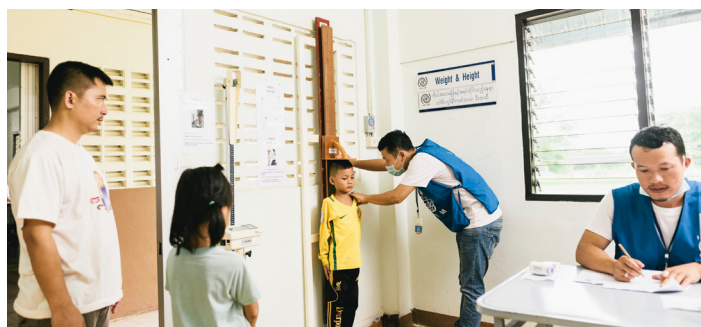
Enfermeros miden y pesan a un niño en una clínica de la OIM en Tailandia.