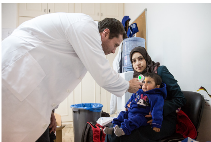
Un médico de la OIM toma la temperatura a una refugiada siria que partirá al Canadá en el marco de un examen previo al embarque.