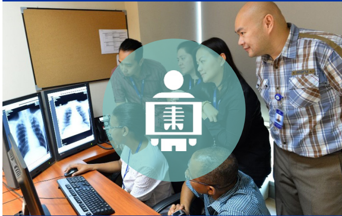
Los dos centros de interpretación radiográfica y control de calidad de la OIM se dedican a la normalización y optimización de los servicios de radiología de la OIM.