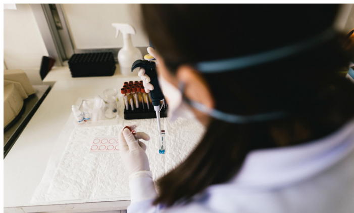
Preparación de muestras de sangre para su análisis en un laboratorio de la OIM.