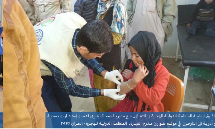
الفرق الطبية للمنظمة الدولية للهجرة وبالتعاون مع مديرية صحة نينوى قدمت إستشارات صحية وأدوية الى النازحين في موقع طوارئ مدرج القيارة.