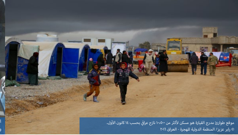
موقع طوارئ مدرج القيارة هو مسكن لأكثر من ١٠,٥٠٠ نازح عراقي بحسب ١٤ كانون الأول.